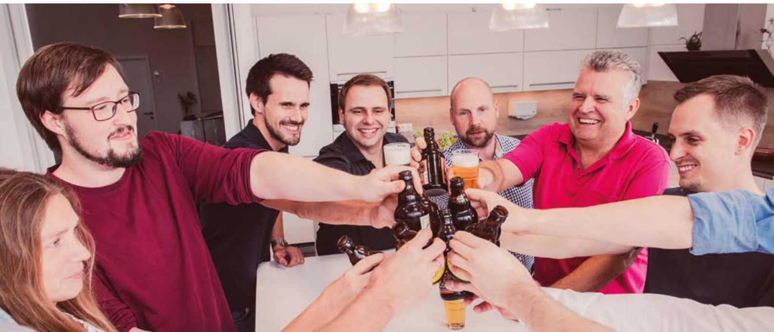
Auch der Spaß kommt bei uns nicht zu kurz

Arbeitsplatz: Große, helle und moderne Büroräume, hoher Komfort, Pflanzen und ausgewählte Dekorationen