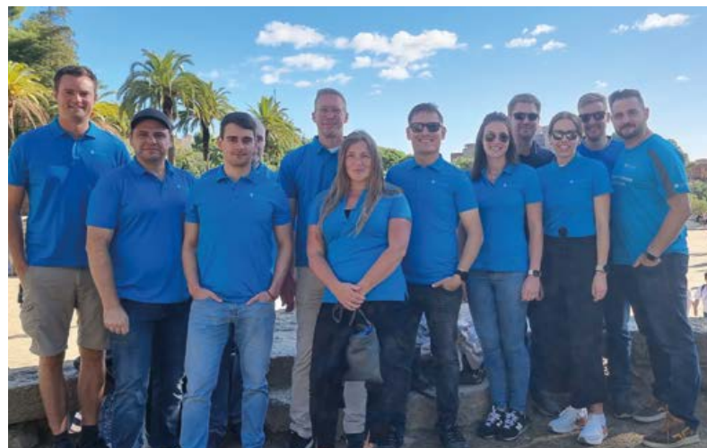
Ausflug unseres Consulting-Teams nach Barcelona

Weitere wertvolle Benefits: Kostenloser Kaffee, 2x pro Woche interne Köchin, Wasserspender mit Sprudel und Kühlung, Feierabendbier mit den Kollegen, Betriebliche Gesundheitsvorsorge, vollausgestattete Küche