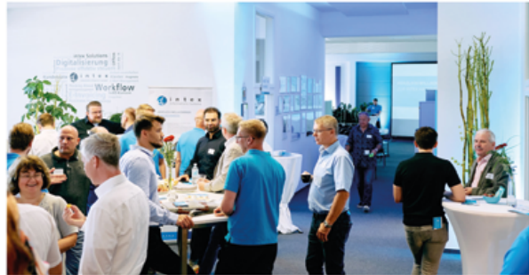
Über 100 Gäste befassten sich bei „intex“ mit dem Thema „Purchase-to-Pay“.

HAUSMESSE Wetzendorfer Unternehmen lud ein.